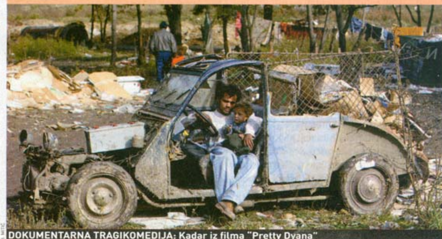
DOKUMENTARNA TRAGIKOMEDIJA: Kadar iz filma “Pretty Dyana”

ne, traje 82 minuta i pripada kategoriji celovečernjeg dokumentarnog filma. Međutim, njima je bilo bitnije da to vreme upotrebe za više kratkih filmova i da tako zadovolje više producenata. Razumljivo, ja nemam ni zvaničnu producersku firmu. Moja firma Dribbling Pictures postoji samo na internet prezentaciji.